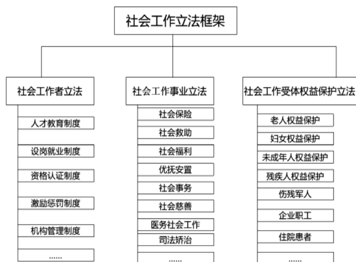
图二：社会工作立法框架

(一) 社会工作立法框架结构 社会工作立法包括主体立法、事业立法和受助群体利益保护立法三个部分，见图二。