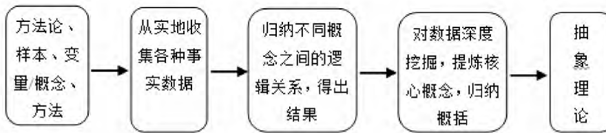
图2 理论建构研究的过程和步骤

具体来说，质的研究就是从经验事实出发，建立事实之间的联系，朝着更抽象的观念或理论前进。首先从实地收集事实数据，在数据分类的基础上，对数据不断进行比较和挖掘，从中归纳出不同概念之间的逻辑关系，最终形成更为抽象的关系或理论。如图2显示了质的研究建构理论的过程、主要步骤和领域。但是必须指出的是，这个过程的结果恰恰是理论建构过程的开始。